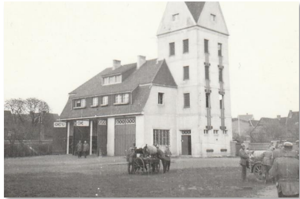
Fertiges Gerätehaus mit Schlauchturm

Eine erste vorhandene und bekannte Satzung unserer Wehr datiert auf das Jahr 1935.