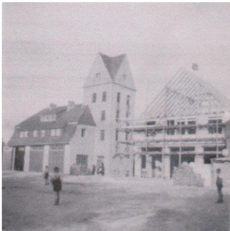
15.03.1937 Baubeginn 2. Gerätehaus

Im Jahr 1937 begann der Bau eines zweiten Gerätehauses, direkt neben dem ersten Gerätehaus in der heutigen Lindenstraße. Das Gebäude II ist heute noch vorhanden. Inzwischen umgebaut, nutzen es u.a. unsere Kinder- und Jugendfeuerwehr.