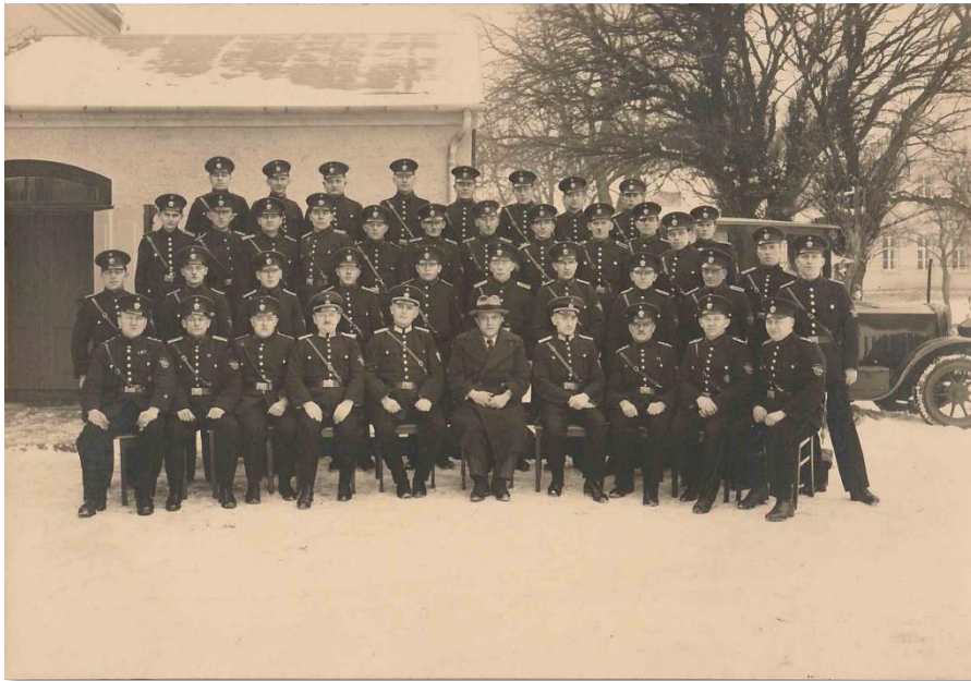
Erstes (vorhandenes) Gruppenbild von 1936

Im Jahr 1937 begann der Bau eines zweiten Gerätehauses, direkt neben dem ersten Gerätehaus in der heutigen Lindenstraße. Das Gebäude II ist heute noch vorhanden. Inzwischen umgebaut, nutzen es u.a. unsere Kinder- und Jugendfeuerwehr.