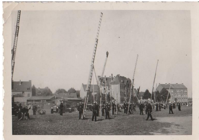
Vorführung (zwischen 1933 und 1935)