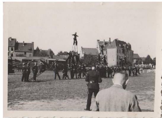
Vorführung (zwischen 1933 und 1935)