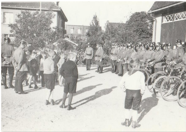
Erhalt des neuen Feuerlösch- und Sprengwagens