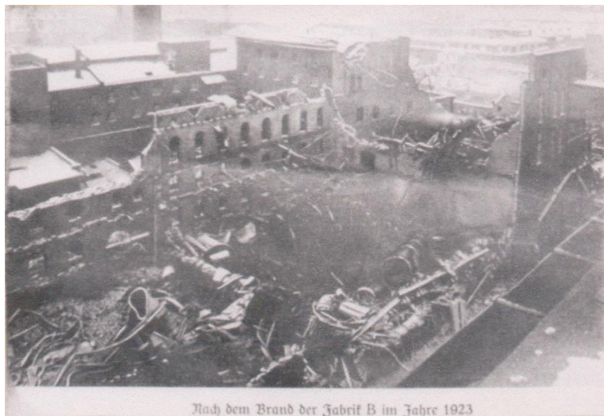
Großfeuer in Meyersche Zuckerraffinerie, Fabrik B

Am 03.12.1927 wurde das erste Gerätehaus in der heutigen Lindenstraße erbaut. An diesem Standort ist unsere Feuerwehr noch heute zu finden. Damit hatte es ein Ende, dass die Geräte unserer Feuerwehr in der gesamten Stadt verteilt waren.