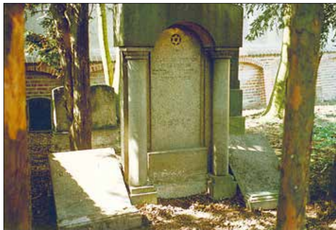
Jüdischer Friedhof 1997

Der Tangermünder jüdische Friedhof ist seit 1941 geschlossen und verwaist. Die letzte Bestattung auf ihm war die von Paul Bernhard im Januar 1941. (An ihn erinnert ein Stolperstein vor dem Haus Lange Straße 20.) Ein Zeitungsfoto aus dem Jahre 1939 zeigt ihn noch in einem gepflegten Zustand. Nach dem Zweiten Weltkrieg wurde die Stadtverwaltung von Tangermünde von der sowjetischen Militär-Administration dazu verpflichtet, den jüdischen Friedhof zu pflegen. Welche Regeln und Bräuche dabei einzuhalten sind, schien damals niemand zu wissen. Alte Fotos, die vermutlich in den 1960er Jahren aufgenommen wurden, zeigen den Friedhof über und über mit Blumen bepflanzt. In den folgenden Jahrzehnten erfolgten keine Pflegearbeiten mehr. Der Friedhof verwilderte zunehmend, diente Kindern als Abenteuerspielplatz und sogar die Wasserleitungen für die Molkerei wurden quer hindurch verlegt.