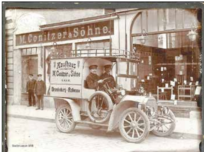
Lieferwagen des Kaufhauses M. Conitzer & Söhne in Brandenburg um 1910

Rund um den 27. Januar, den Tag der Befreiung von Auschwitz, lädt im Landkreis Stendal ein vielfältiges Programm zu einer Woche des Erinnerns und des Denkens ohne Geländer ein. Filme, Theaterstücke, Lesungen, Konzerte, Ausstellungen, Vorträge und Workshops regen dazu an, ins Gespräch über Toleranz, den Umgang mit Gewalt und Wege des Miteinanders in der Gesellschaft zu kommen.