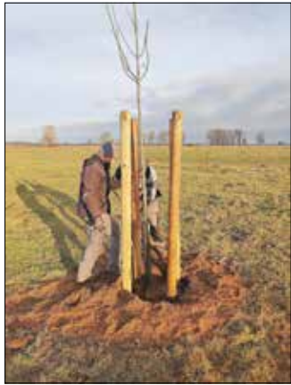
Setzen der Jungbäume - hier eine Esche

Überschwemmungen und des Trockenfallens, sowie ihren kleinräumigen Strukturen, von großer Bedeutung für die lokale Umgebung. Auwälder gelten als die „tropischen Regenwälder Mitteleuropas“, und mit bis 12.000 Tier- und Pflanzenarten sind sie ein „Hot Spot“ der Artenvielfalt und Biodiversität.